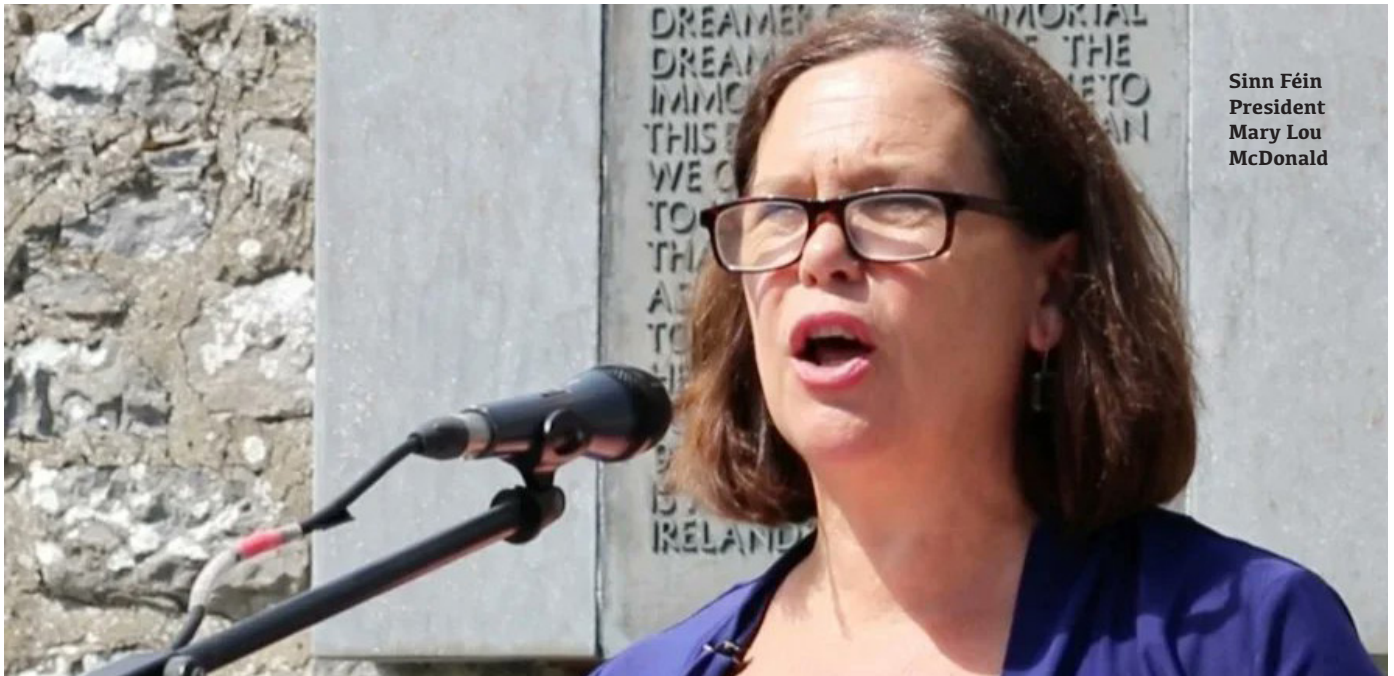
Sinn Féin President Mary Lou McDonald

Ενωμένοι Ιρλανδοί. Αριστεροί ρεπουμπλικάνοι. Αντιιμπεριαλιστές. Αντιρατσιστές. Διεθνιστές.