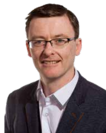
URLABHRAÍ SLÁINTE SPOKESPERSON ON HEALTH