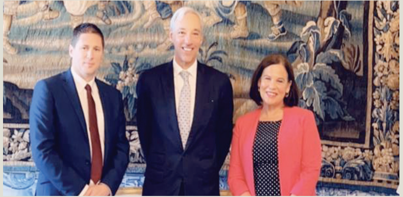
Partiledare McDonald och talesperson i utrikesfrågor Matt Carthy håller möte i Lissabon med Portugals utrikesminister João Cravinho.