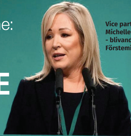
Vice partiledare Michelle O'Neill - blivande Försteminister