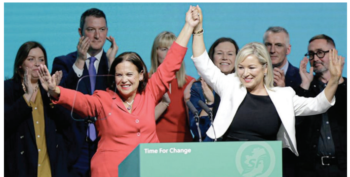
Sinn Féins partiledare Mary Lou McDonald och vice partiledare Michelle O'Neill på kongressen, tillsammans med några av partiets förtroendevalda.

Sinn Féins kongress i Athlone var inte bara en politisk församling, det var ett exempel på kraften i enighet, kollektiv strävan och löftet om en ljusare och mer jämlik framtid för alla.