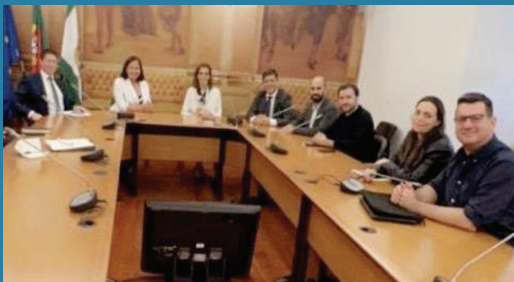
Möte med portugisiska regeringspartiet Socialistpartiet, plus Vänsterblocket och det portugisiska kommunistpartiet.