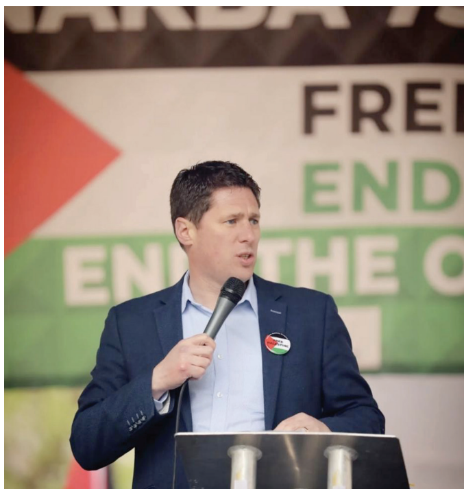
Matt Carthy, Sinn Féin's talesperson i utrikesfrågor

Genom att inte fördöma Israels uppenbara aggression förlorar Europeiska Unionen sin trovärdighet i att vara en röst för fred, internationell lag och mänskliga rättigheter, så länge som de säger ifrån. Kontrasten mot det snabba och entydiga, och ska sägas – korrekta – positioneringen från EU när det gällde Rysslands invasion av Ukraina är tydlig. Men denna position försvagas när en annan måttstock tillåts när det gäller Israel och Palestina. Hamas attack den sjunde oktober var fruktansvärd och har fördömts av sunt tänkande människor från hela världen. Men historien startade inte den sjunde oktober och krigsbrotten den dagen rättfärdigar inte de krigsbrott som Israel har begått varje dag sedan dess. Den medvetna strategin att döda civila, däribland tusentals barn, bombardemanget och förstörelsen av