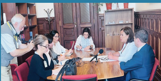
Möte med Portugals pressförening.