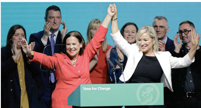
Sinn Féin-præsident Mary Lou McDonald og vicepræsident Michelle O'Neill hos SF Ard Fheis med SF-valgte repræsentanter

Sinn Féin Ard Fheis i Athlone var ikke bare en politisk forsamling; det var et vidnesbyrd om kraften i enhed, kollektiv vision og løftet om en lysere, mere retfærdig fremtid for alle.