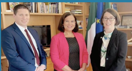
Møde med Irlands ambassadør i Portugal - Alma Ní Choigligh