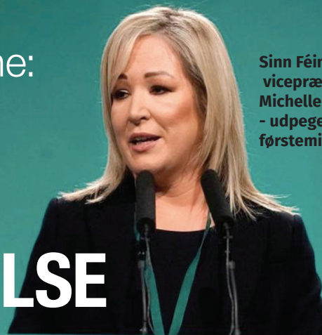
Sinn Féin vicepræsident Michelle O'Neill - udpeget førsteminister