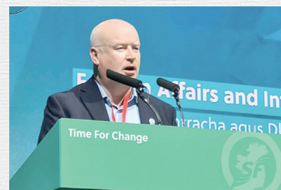
Senator Paul Gavan fra Sinn Féin

og ødelæggelsen af civil infrastruktur, tvungne flytning af næsten 2 millioner mennesker og nægtelse af brændstof, mad og vand til en civilbefolkning er grove overtrædelser af international lov. Det er inden vi overhovedet overvejer de mange brud på international lov, som Israel har påført befolkningen i Palæstina i årtier – besættelse, apartheid, annektering, kollektiv afstraffelse, administrativ tilbageholdelse og de ubarmhjertige angreb på uskyldige palæstinensiske befolkninger; listen fortsætter. Der skal handles som reaktion, fordi Israel ikke vil stoppe, før verden siger stop. Hvis internationale ledere ikke forenes for at handle, må lande som Irland gå i spidsen. Men hvis EU ikke ændrer kurs, vil det miste sin troværdighed til nogensinde igen at pege fingre ad andre aggressive regimer eller at erklære sig selv som en stemme for fred og konfliktløsning.