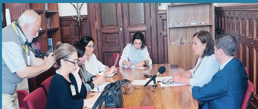
Briefing af den portugisiske Udenlandske Presseforening