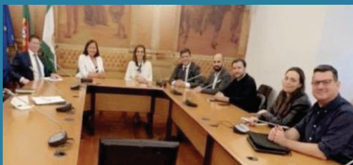
Møde med det portugisiske regeringsparti, Socialistisk Parti (PS), sammen med Bloco de Esquerda (venstreblokken) og det portugisiske kommunistparti (PCP)