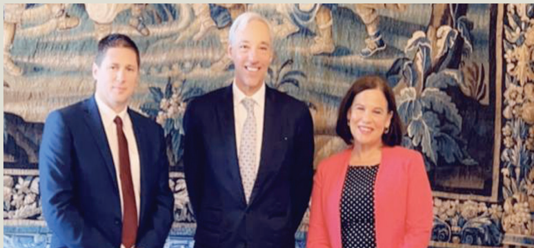
Præsident for Sinn Féin Mary Lou McDonald og SF's udenrigsordfører Matt Carthy mødes i Lissabon med den portugisiske udenrigsminister João Cravinho