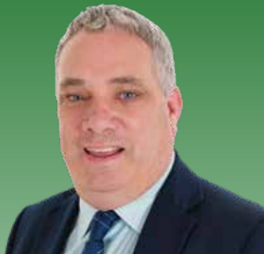
Aengus Ó Snodaigh TD

Aighneacht Scríofa Shinn Féin ar an bpróiseas comhairliúcháin chun polasaí a fhorbairt don oideachas lán-Ghaeilge lasmuigh den Ghaeltacht