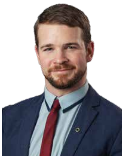
Donnchadh Ó Laoghaire TD

Urlabhraí Gaeilge, Gaeltachta, Ealaíon agus Cultúir Shinn Féin Cathaoirleach ar Chomhchoiste Oireachtais na Gaeilge, na Gaeltachta agus Phobail Labhartha na Gaeilge